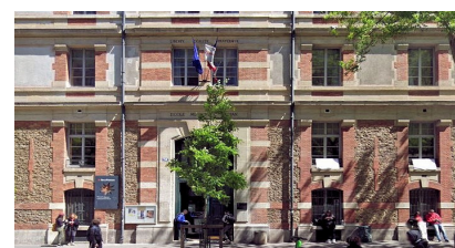
Lycée Général Technologique et Professionnel CFA GRETA DORIAN Siège de la Section de Paris de l'AFDET

Il interviendra au niveau national en lien direct avec le Président et le bureau pour la recherche de moyens, de partenariats et la communication nécessaires au projet et sa capitalisation, à la formation des acteurs concernés. En relation avec les comités régionaux, il œuvrera au rapprochement AFDET – Campus - Territoires d'industrie en constitution, ainsi qu'à la mutualisation des expériences et des initiatives entre le niveau national et les régions.